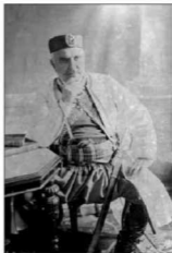
Rudolf Smodlaka, Knjaz Nikola

Na fotografijama Smodlake kralj je pozirao nekoliko puta. Uхваćen je kako opušteno sjedi na stolici oslonjen desnom rukom o stilski sto i, tri puta, u stojećem stavu, predstavljen kao polufigura, presječen formatom fotografije nešto ispod bokova. Obučen je u raskošan crnogorski kostim, sa kapom na glavi i visokim kožnim čizmama. Izraz vladarevog lica je ozbiljan, pogled zamišljen, uprt u posmatrača, pokazuje odlučnost i čvrstinu, iako je već u podmaklim godinama života. Brojna odlikovanja po lijevoj strani prsa ističu reprezentativnost u stavu i izrazu. Finom opservacijom fotografu je uspjelo da pronikne u "dušu" modela i da istakne njegovu osobenu autoritativnost, samosvjesnost i harizmu.