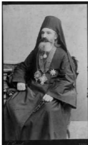
Tomaso Burato, Episkop Nikodim, 1895. Pr. br. 92

Dimenzije: 19 x 11,8 cm; kartonska podloga: 21,5 x 13,5 cm