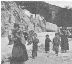
Jaroslav Čermak: Crnogorica sa djetetom

Postoje brojna vjerovanja i čitav sistem praznovjernih radnji, koje trudna žena valja ili ne valja da radi, kojih se i ona i članovi njene zajednice striktno pridržavaju: