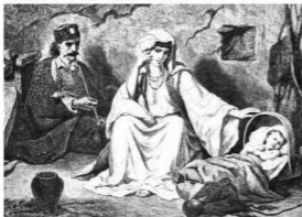
Teodor Valerio - crnogorski enterijer

Vjerovanja u zle oči, vještice i uroke koji se javljaju kao rezultat njihovog negativnog djelovanja, su veoma raširena u svim krajevima Crne Gore, a mnoga od njih nijesu ni do danas u potpunosti iskorijenjena.